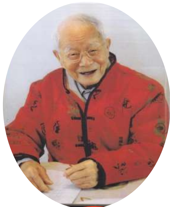
国医 大师 邓鉄涛