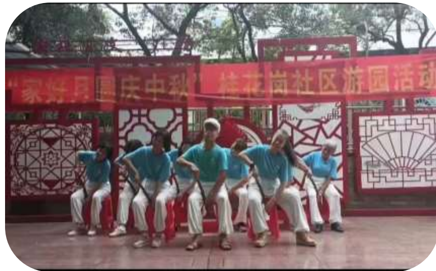
中医药文化项目组到桂花岗社区活动