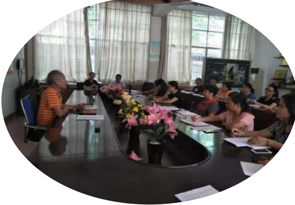
3★ 花都秀塘小学交流学习