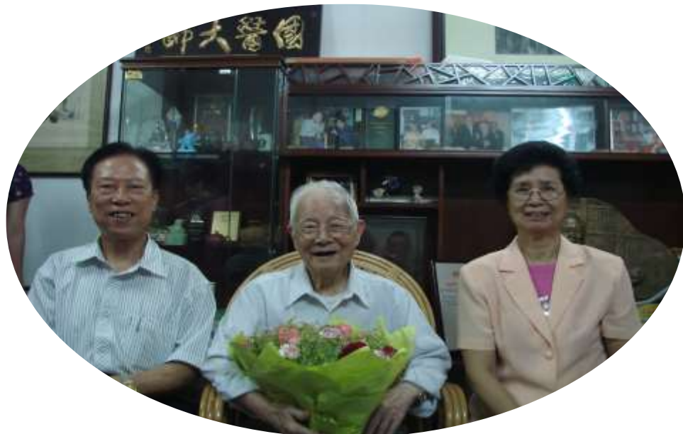
百岁 工程 总指导