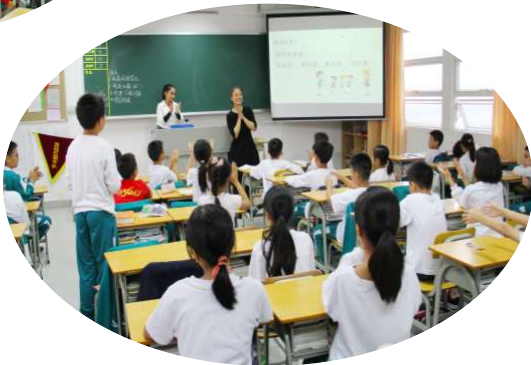
12★ 中医药文化项目组到顺德实验小学活动